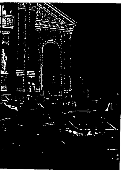
Alcune immagini del Raid dell'Etna Pictures from Raid dell'Etna